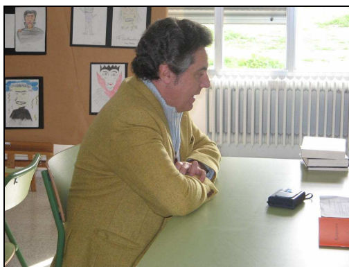
El escritor en la Biblioteca "Santiago Apóstol"

lecturas muy desordenadas. Nunca es un sólo libro a la vez. Voy cogiendo uno, voy cogiendo otro, siempre tengo como cinco o seis libros a la vez que estoy leyendo.